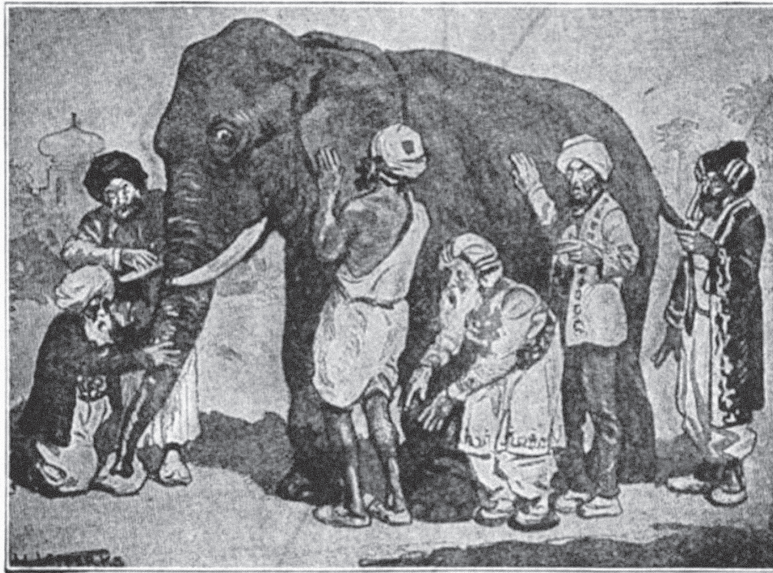
■ Εικόνα 1-2: Σοφοί άνδρες χωρίς όραση προσπαθούν να αναγνωρίσουν έναν ελέφαντα. Ινδικός μύθος.

στενού συστήματος της οικογένειας και κοινωνικών συστημάτων (σχολείο, παρέες) του ευρύτερου περιβάλλοντος. Ανοίγει, επίσης, τον δρόμο για τη συμμετοχή των γονέων στη θεραπεία του παιδιού και τον μετασχηματισμό των δικών τους Γνωσιακών Κύκλων. Τελικός σκοπός, η Επικοινωνιακή Αναδόμηση (Fourlas & Marousos, 2014· 2015). Δηλαδή, το παιδί που τραυλίζει (α) να αναδομήσει τον επικοινωνιακό του ρόλο («μπορώ να επικοινωνώ αποτελεσματικά») (β) να αναπροσδιορίσει την έννοια της επικοινωνιακής 'αποτυχίας' ή 'επιτυχίας' («πήρα αυτό που ήθελα και τραύλισα») (γ) να ανταποκρίνεται στις απαιτήσεις της επικοινωνιακής περίπτωσης με τρόπο λογικό (με νόημα) και λειτουργικό («κάνω την τεχνική Αεροπλανάκι, για να βοηθηθώ να ξεκινήσω την πρόταση στην ανάγνωση στην τάξη»).